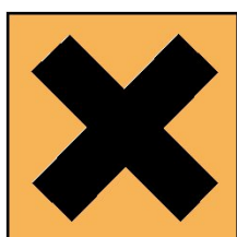
Xn - Nocif