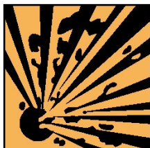
E - Explosif