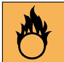
O - Comburant