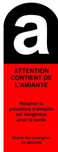
Matériaux contenant de l'amiante