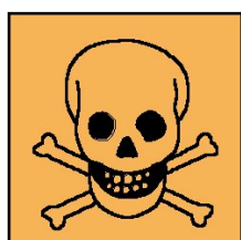
T - Toxique