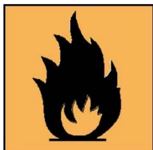
F - Inflammable