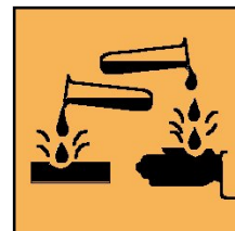
C - Corrosif